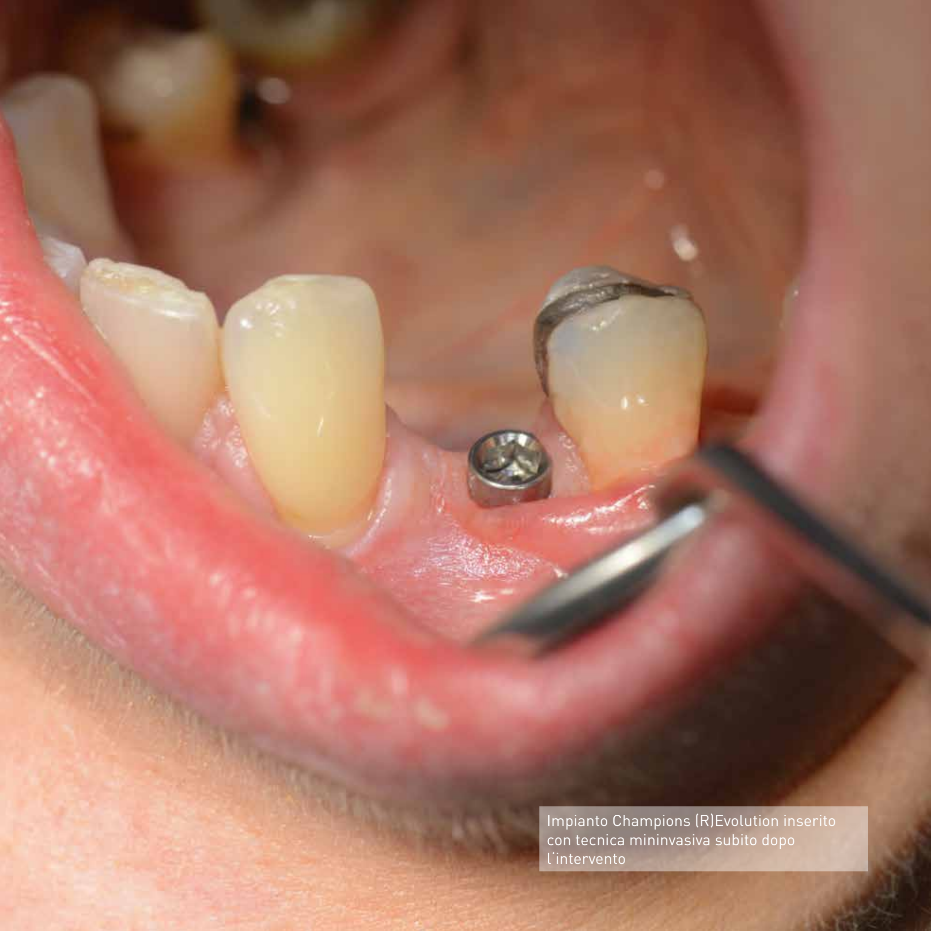
Impianto Champions (R)Evolution inserito con tecnica mininvasiva subito dopo l'intervento