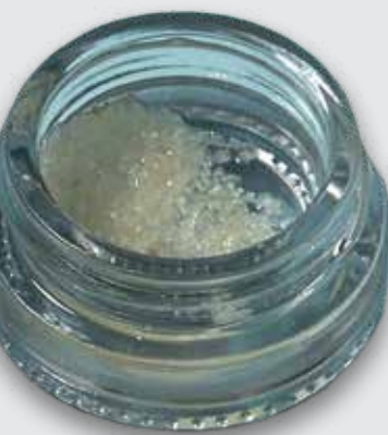
Gemahlener und aufbereiteter extrahierter Zahn zum Auffüllen des Zahnfachs.

In dieser Praxis wendet man das Smart Grinder-Verfahren an: Ihr gezogener Zahn wird mechanisch gereinigt und von Amalgam, Bakterien etc. befreit. Danach wird er im Smart Grinder gemahlen und in das leere Zahnfach eingefüllt. Ihnen wird also kein fremdes Material, z. B. vom Rind, eingesetzt, sondern Ihr eigener Zahn wieder zurückgeführt.