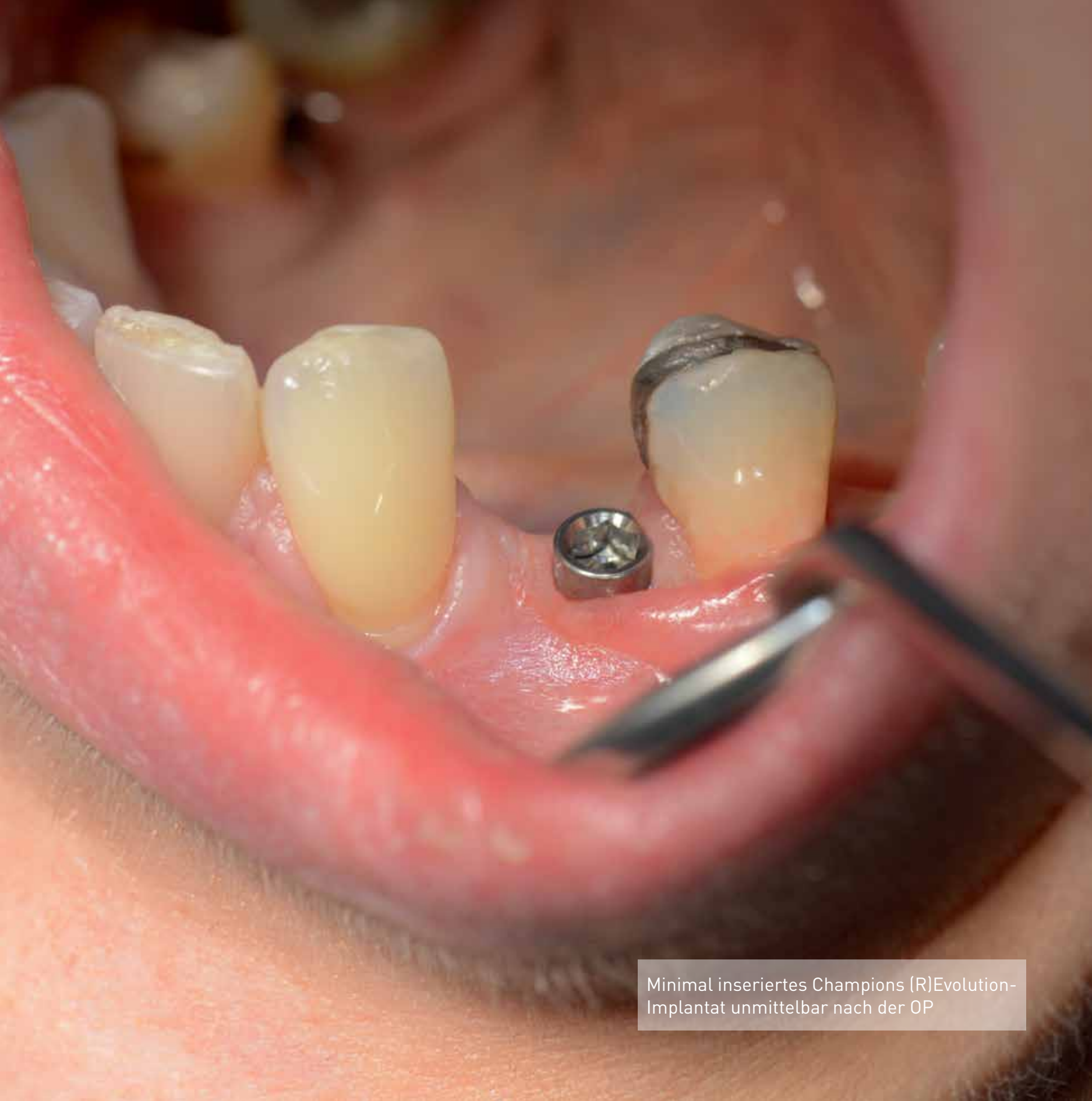
Minimal inseriertes Champions (R)Evolution-Implantat unmittelbar nach der OP